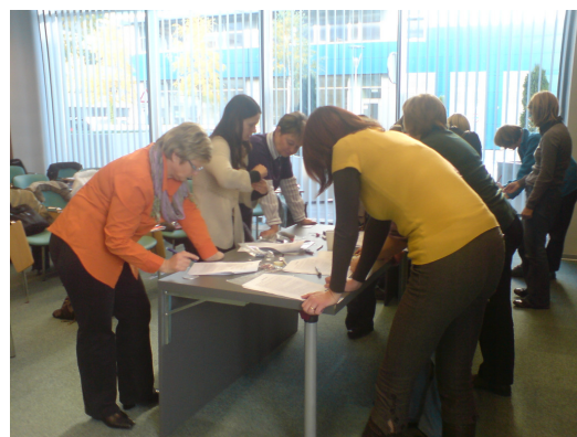
Delo v skupinah