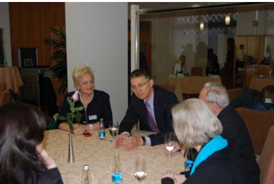
Konferenca se je udeležil tudi minister za šolstvo in šport, dr. Igor Lukšič

NOVEMBER 2010 —Mednarodna znanstvena konferenca z naslovom Socialne in čustvene potrebe nadarjenih in talentiranih (prezentacije predavateljev si lahko ogledate na spletni strani www.nadarjen.si )