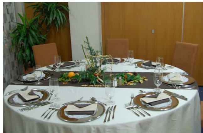
Večerni pogrinjek—Višja šola za gostinstvo in turizem BLED