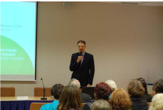
Uvodni nagovor ministra za šolstvo in šport, dr. Igorja Lukšiča